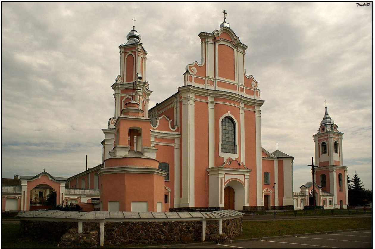
(Фасад Борунского костел Святых Петра и Павла)