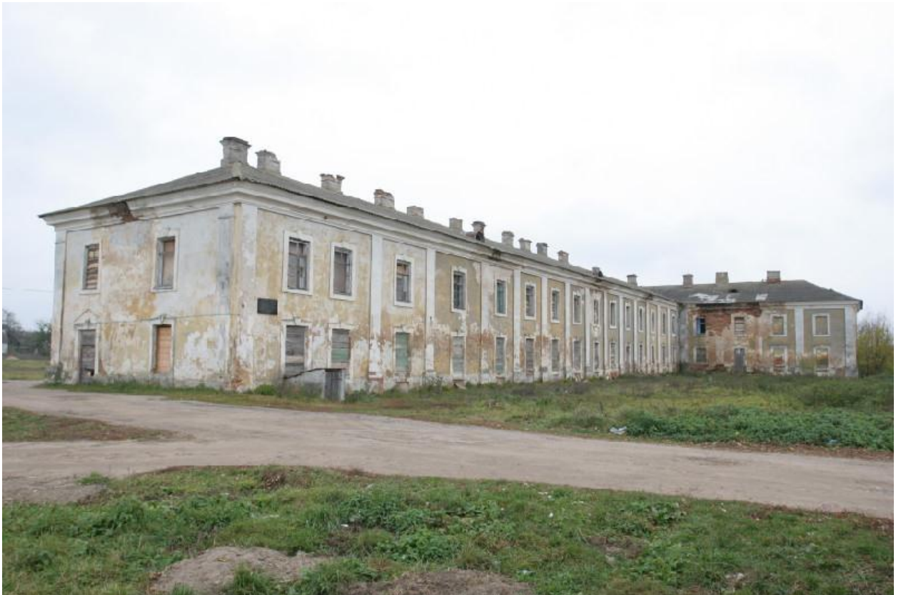
(Здание монастыря а.г. Боруны)