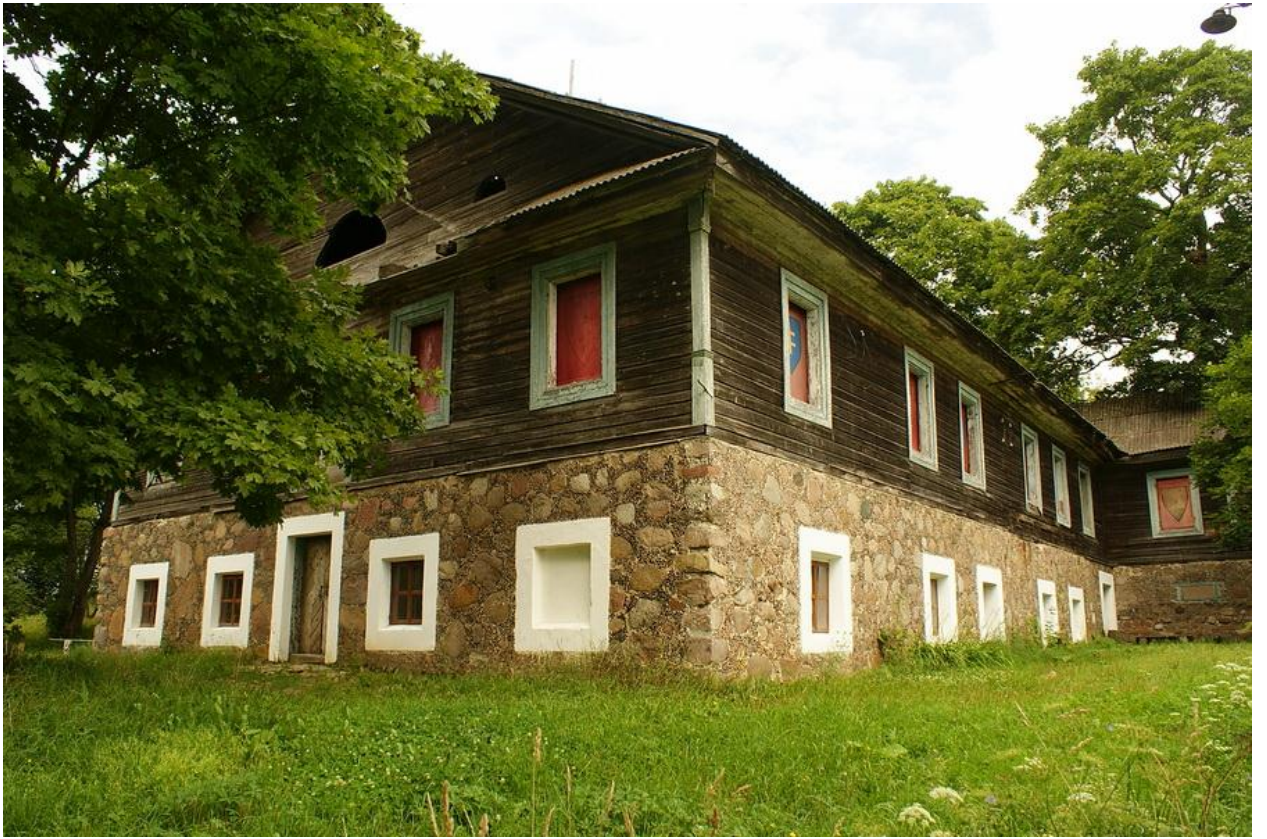
(Здание родового имения Ж. Карчевского в д. Бенюны)