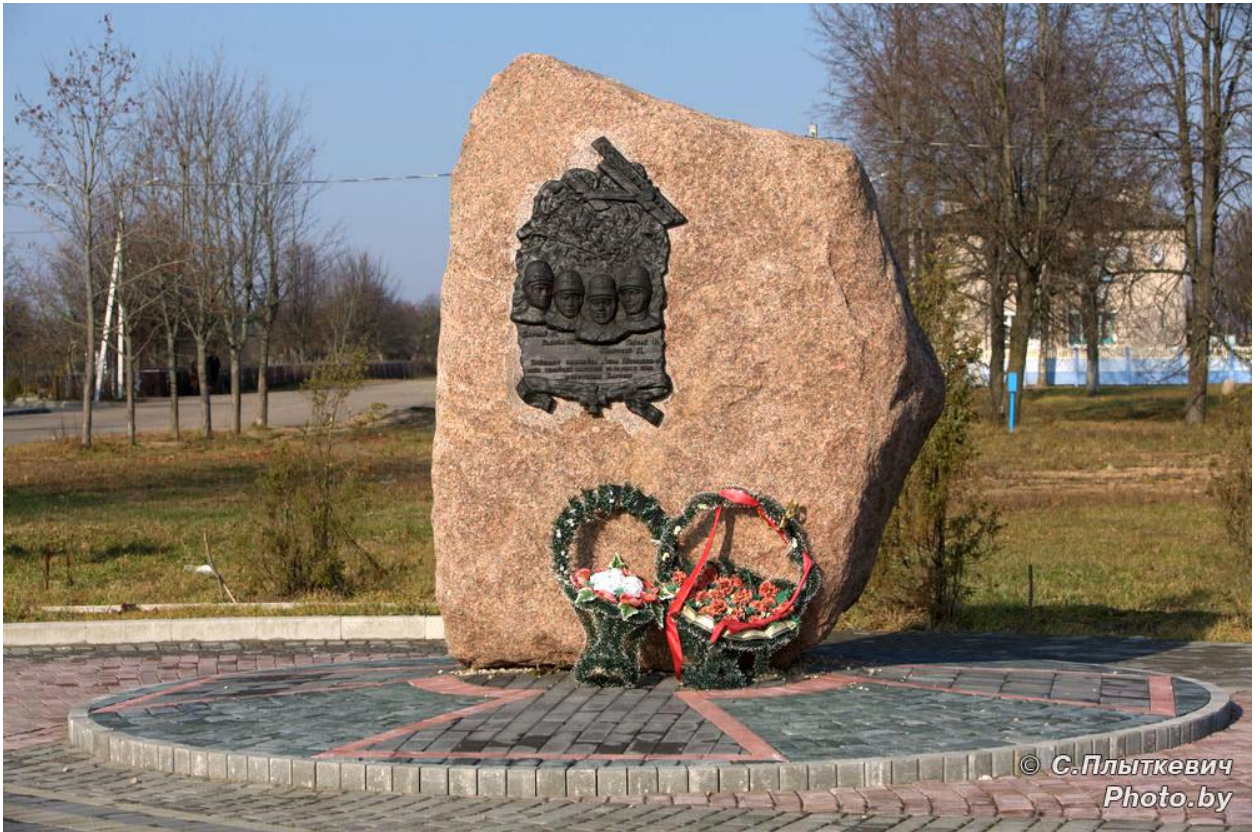
(Памятник экипажу самолета «Илья Муромец»)