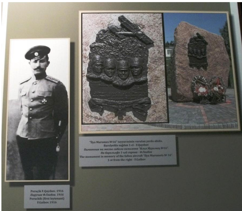
Poruçik F.Qayıbov. 1916 Поручик Ф.Гаибов. 1916 Poruchik (first leytenant) F.Gaibov. 1916