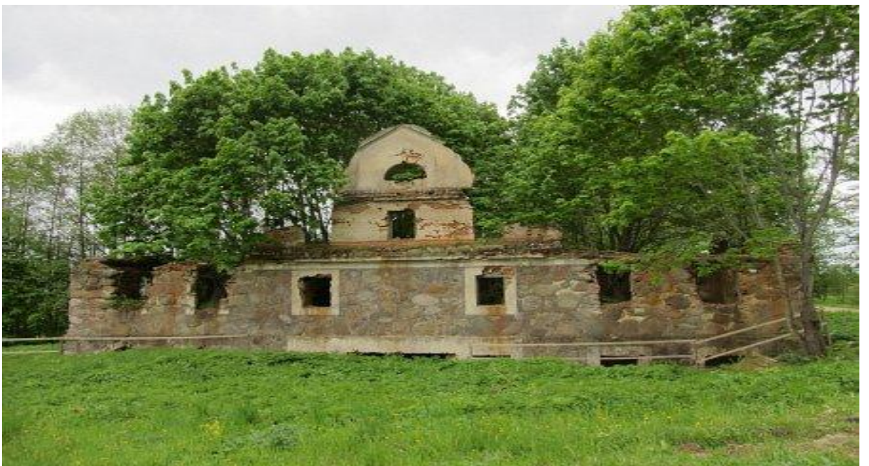
(Остатки здания хозяйственных построек родового имения Ж. Карчевского в д. Бенюны)