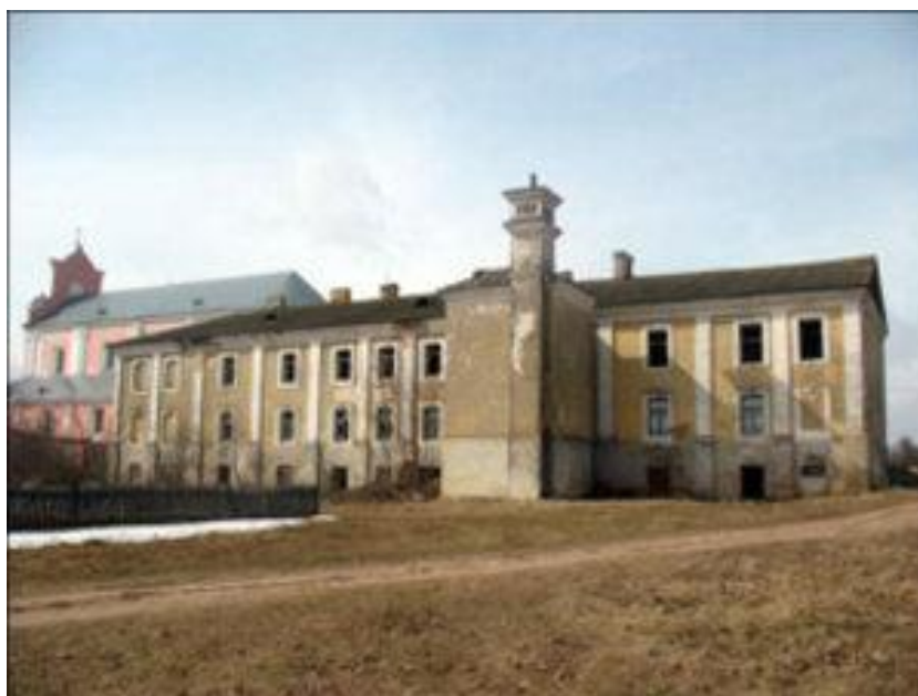
(Здание монастыря а.г. Боруны)