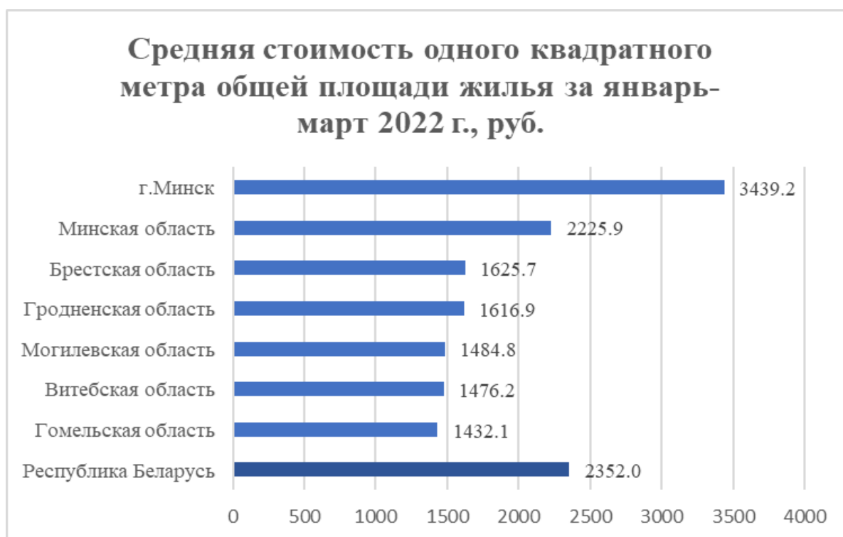
Рисунок 1 – Средняя стоимость 1 кв.м общей площади жилья (январь–март 2022 г.)